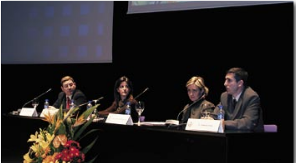
Integrantes de la mesa de presentación del área de colegiados del portal web.

Para finalizar, el coordinador del grupo de trabajo expuso las propuestas para el 2006 que se centran en ampliar las comunidades, crear un observatorio socio-labo-