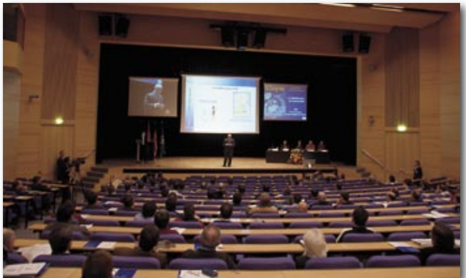
Salón de actos del Palacio de Congresos durante la presentación.

primeros lugares de la economía de España”.