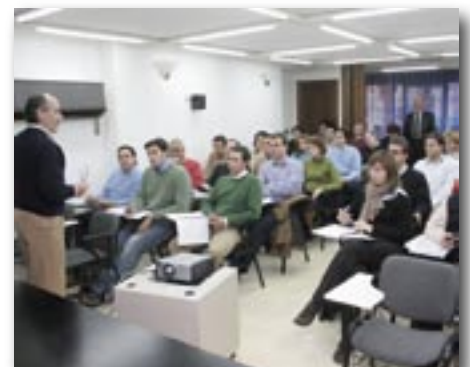
Asistentes al curso.

La duración del master será de 10 meses, con carácter semipresencial y constará de un total de 600 horas, de las cuales 330 serán de estudio, 150 de proyecto del Máster y 120 horas lectivas. En la sede del colegio se puede disponer del programa del máster. ■